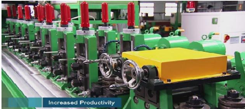
Thông số kỹ thuật